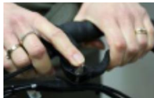
Lock pen naar beneden duwen