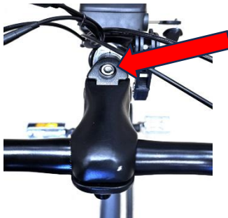
Afstellen stuur hoogte