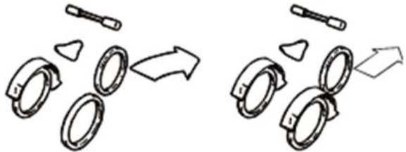
Fiets zonder differentieel

Door het differentieel worden beide wielen onafhankelijk van elkaar aangedreven. De fiets gaat hierdoor recht vooruit en bochten zijn gemakkelijker te nemen.