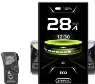
Accu indicatie display Bafang

Het display geeft aan hoe vol de accu is. Controleer of de accu vol is wanneer je (grotere) afstanden aflegt. Het witte blokje wordt korter naarmate de accu leger wordt. Is het blokje geheel wit, dan is de accu vol. Tevens is er een accu indicatie op de accu zelf. Bij accucapaciteit van 20% of lager zal de ondersteuning automatisch minder worden om de accu te sparen.