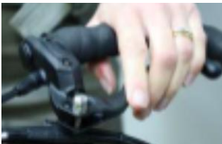
Knijp in de remhendel

Knijp de rechter remhendel in en duw de pen naar beneden om de parkeerrem in te schakelen. Om de parkeerrem los te zetten, hoeft u alleen maar de remhendel in te knijpen en los te laten.