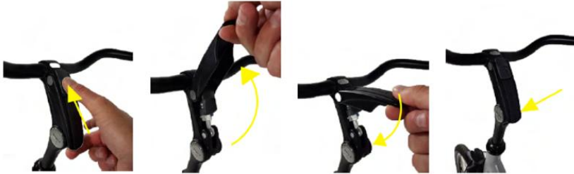
Instellen switch stuurpen