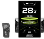
Display en het stuur